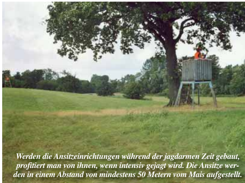
Werden die Ansitzeinrichtungen während der jagdarmen Zeit gebaut, profitiert man von ihnen, wenn intensiv gejagt wird. Die Ansitze werden in einem Abstand von mindestens 50 Metern vom Mais aufgestellt.