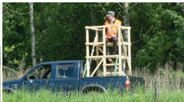
Wenn durch die Geländeform ein Kugelfang vorhanden ist, können auch niedrigere Ansitzeinrichtungen eingesetzt werden, wie z. B. landwirtschaftliche Anhänger oder Pickup mit Aufsatz. Hohe Fahrzeugaufbauten mit Geländer oder Arbeitskörbe im angehobenen Schlepperfrontlader mit sicherem Aufstieg eignen sich auch als Ansitzeinrichtung. Sie dürfen aber alle während des Treibens nicht umgesetzt werden!